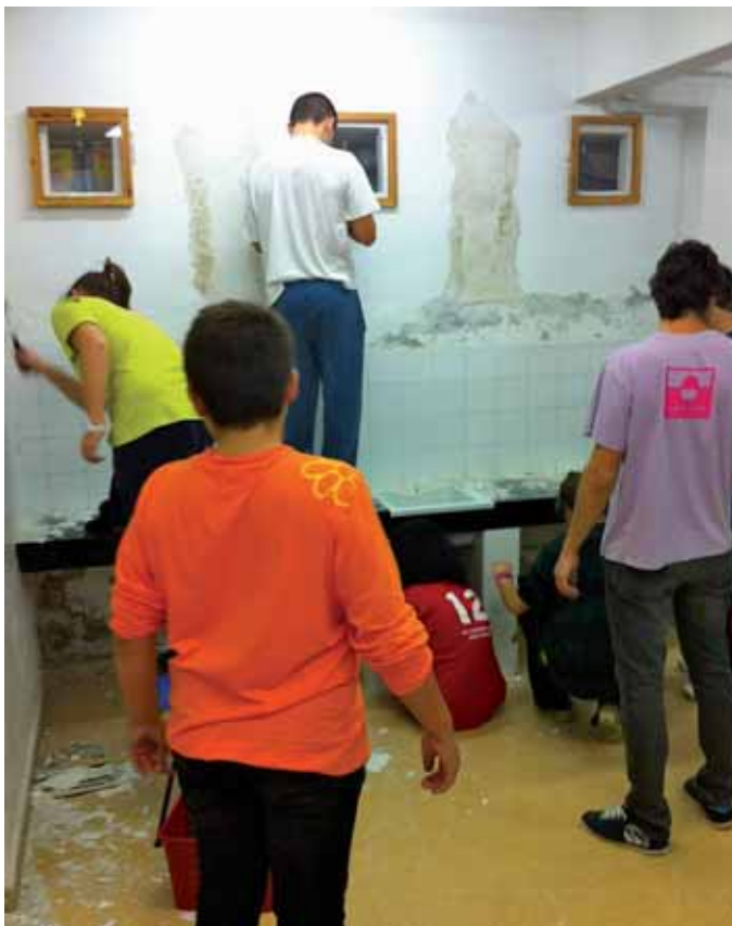
Jóvenes del Gazteleku, trabajando codo con codo para decorarlo a su gusto.

ri batzuetan abian jarritako antzeko ekimenen analisia, etabar.