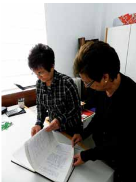
Historia polita ari da osatzen Adintsuen Elkarte.

egiten da, eta egun horretan be hainbat gauza egiten doguz. Eta gure jaietan, Andra Marietan, batzordeak (Basobaltz Jai Batzordea) Jubiladuen Eguna antolatzen dau; aurten, irailaren 9an izan zan, eta bazkari zoragarria euki gendun. Azken baten, alternatibak eskaintzen doguz, Lezamako persona nagusiek jubilazioaz gozau dagien, merezi dogu eta. Egin behar dan gauza bakarra gura izatea da, eta pausoa emotea.