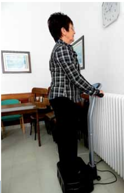
Gimnasia y cartas en el local: ejercicio corporal y mental para amama y aitite mientras disfrutan en buena compañía.

Horixe da arazoa: gero eta jente gitxiagok emoten dauela izena. Gainera, gauza bitxia jazonen da: gai honegaz gehiago interesetan dirala Lezamara azken urteotan heldu diran fami-