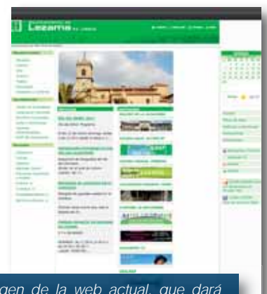
Imagen de la web actual, que dará paso a una más moderna y práctica.

Asimismo, la nueva web ofrecerá la información más actual del municipio, con una gran cantidad de contenidos,