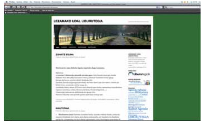
Blog de la biblioteca de Lezama.