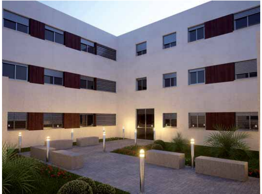
Herri askok etxebizitza tasatuen aldeko apustua egiten dute, bertako biztanleei lehenasuna emateko.

La Ordenanza, disponible en la web del Ayuntamiento de Lezama, establece las características de las viviendas y